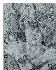
小説「虫」(作: 毒猫)の挿絵(絵: うどん)